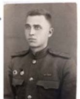
15 августа 1945

«Нет в России семьи такой, Где б не памятен был свой герой...»